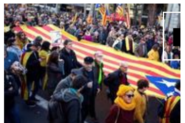
La manifestación contra el del 'procés', en imágenes