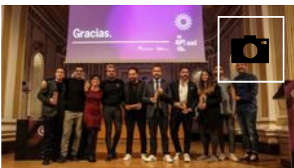
La Asociación Andaluza de Diseñadores entrega los IV Premios del Diseño