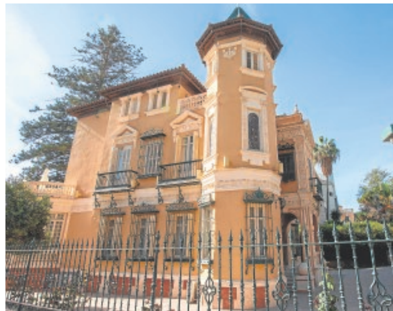
El palacete Villa Onieva, un edificio protegido, nueva sede de Roca Junyent-Gaona, Palacios y Rozados en Málaga