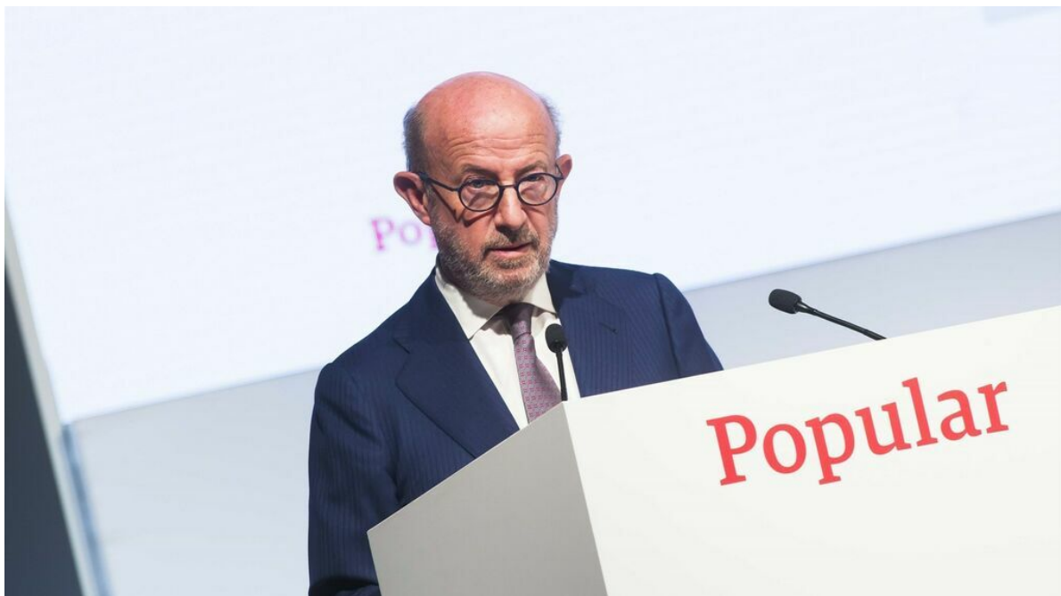
Emilio Saracho, expresidente de Banco Popular.

Emilio Saracho, presidente de Banco Popular entre febrero y junio de 2017, acude hoy a la Audiencia Nacional para declarar en calidad de investigado por supuesta manipulación del mercado. Saracho ha preparado su defensa con abogados de primer nivel